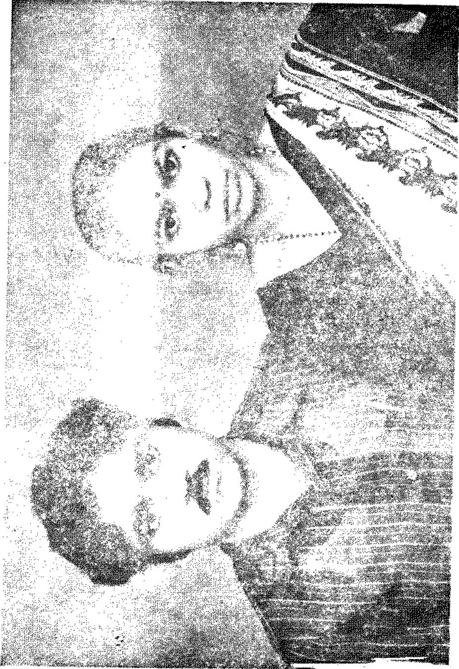
జాన : వస్తుతా అంజనేయమూర్తి నోనరి : ప్రబురాంబ